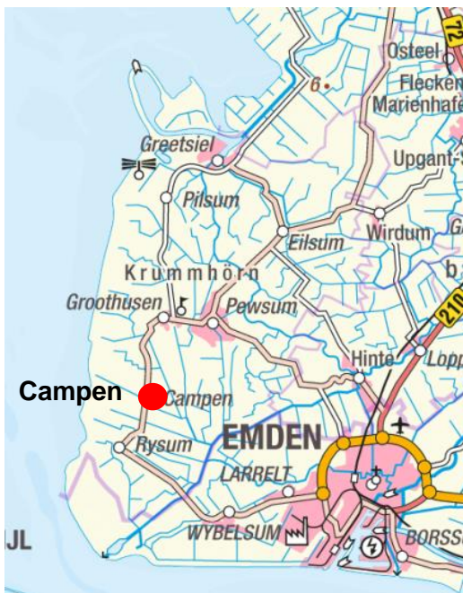
Gemarkung Campen, Flur 1